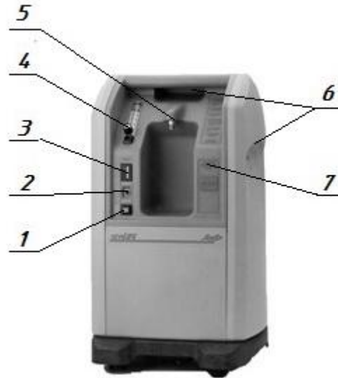
Рисунок 1 – Основные органы управления концентратора

Ознакомьтесь с важными частями кислородного концентратора показанными на рисунке 1.